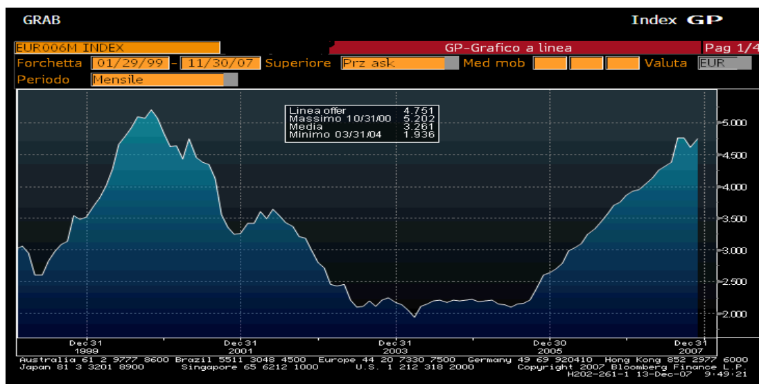
Andamento storico del parametro di indicizzazione