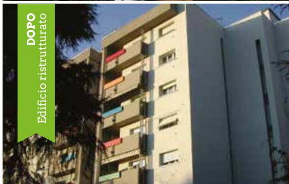
DOPO Edificio ristrutturato