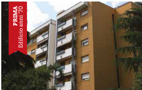
PRIMA Edificio anni '70